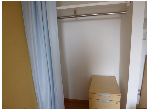
Private room 2