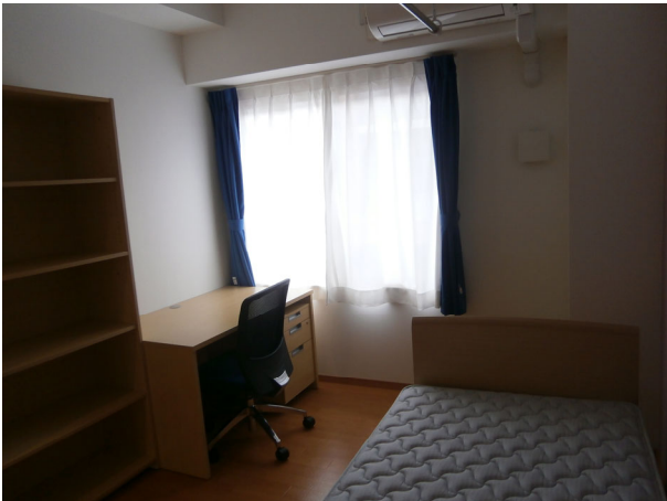
Private room 1