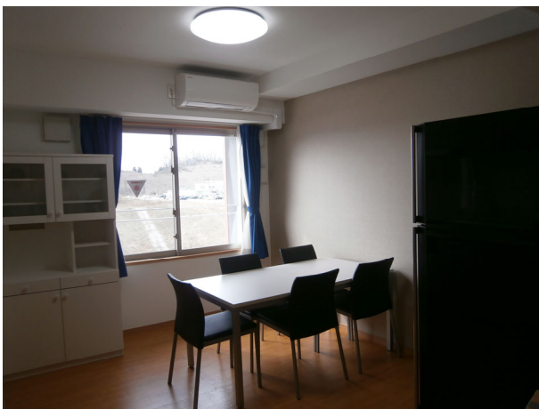
Living, Dining, Kitchen